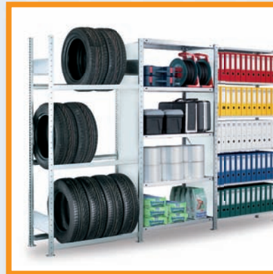
Reifenregale, Büroregale, Werkstattregale und Regalsysteme