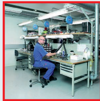
Betriebs- und Werkstatteinrichtungen