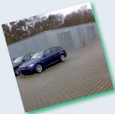
Schnellbauhallen / Reifenlagerhallen