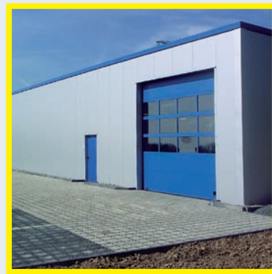
Industrie- und Gewerbebau