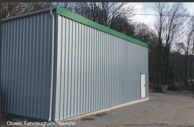
Objekt: Fahrzeughalle, Iserlohn