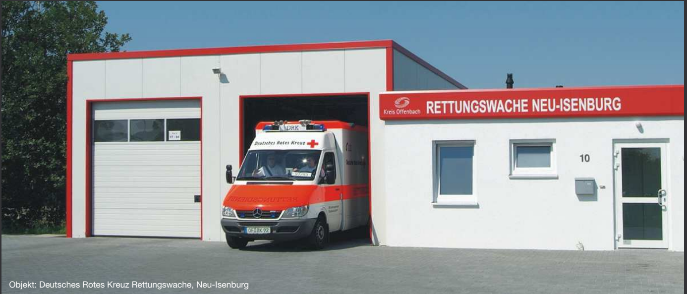
Objekt: Deutsches Rotes Kreuz Rettungswache, Neu-Isenburg