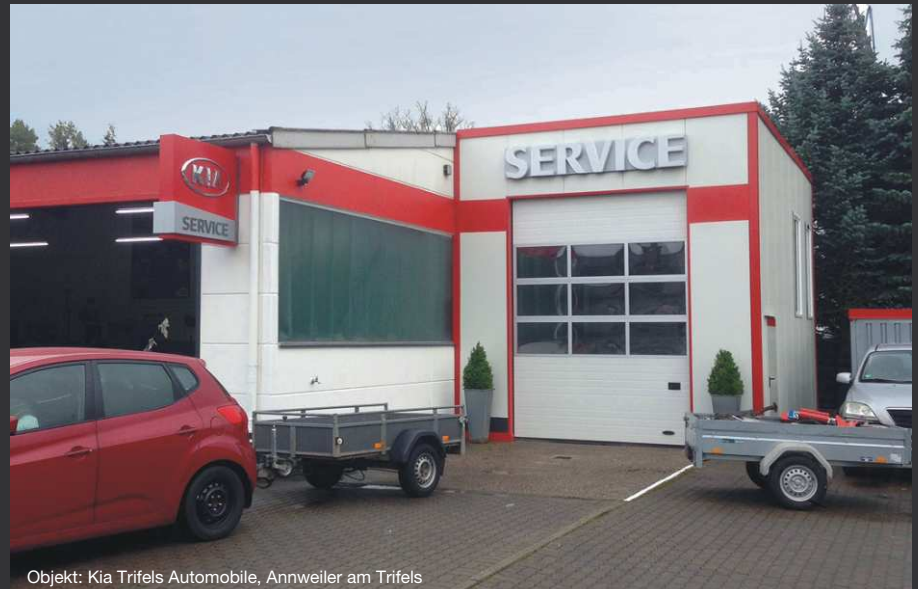
Objekt: Kia Trifels Automobile, Annweiler am Trifels