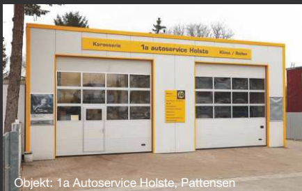
Objekt: 1a Autoservice Holste, Pattensen