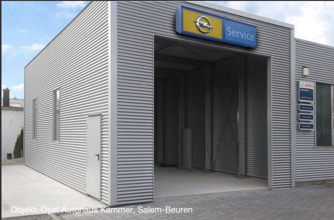
Objekt: Opel Autohaus Kammer, Salem-Beuren