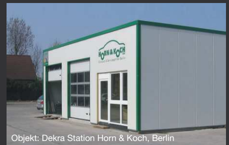
Objekt: Dekra Station Horn & Koch, Berlin