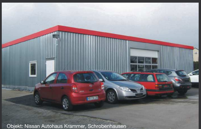
Objekt: Nissan Autohaus Krammer, Schrobenshausen