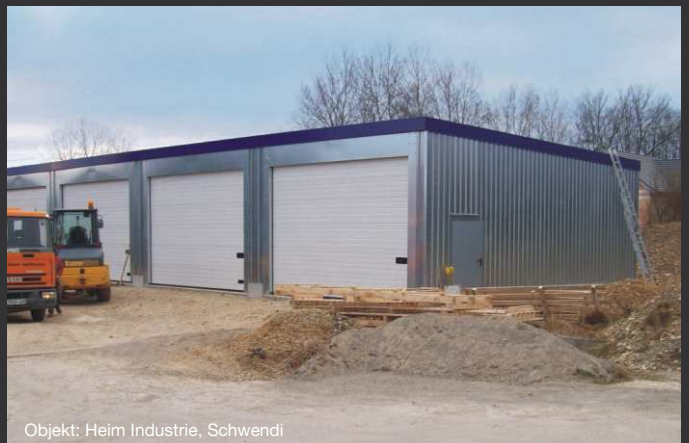
Objekt: Heim Industrie, Schwendi