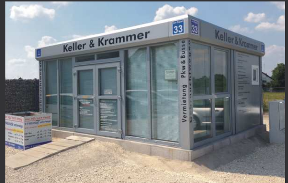
Verkaufspavillons / mobile Büros