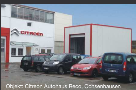
Objekt: Citroën Autohaus Reco, Ochsenhausen