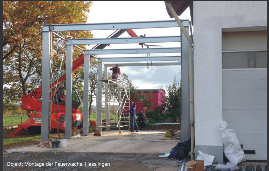
Objekt: Montage der Feuerwache, Hesslingen

Eine spätere Erweiterung und auch die Versetzung an einen anderen Einsatzort sind ohne große Probleme möglich.