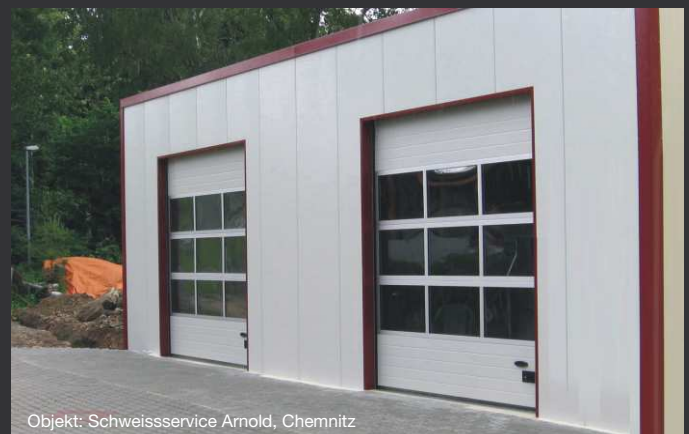
Objekt: Schweisservice Arnold, Chemnitz