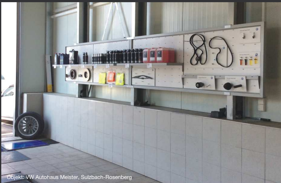
Objekt: VW Autohaus Meister, Sulzbach-Rosenberg

Die Konstruktion unserer Hallensysteme bietet sowohl den Platz als auch die erforderliche Tragkraft, die für die bauseitige Befestigung von Verkaufswänden und Regalen benötigt werden. Eine Investition, die sich nachhaltig für Sie rechnet.