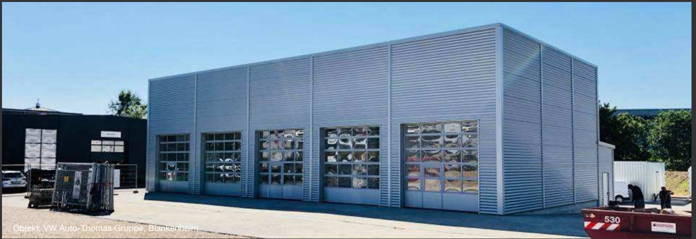
Objekt: VW Auto-Thomas Gruppe, Blankenheim