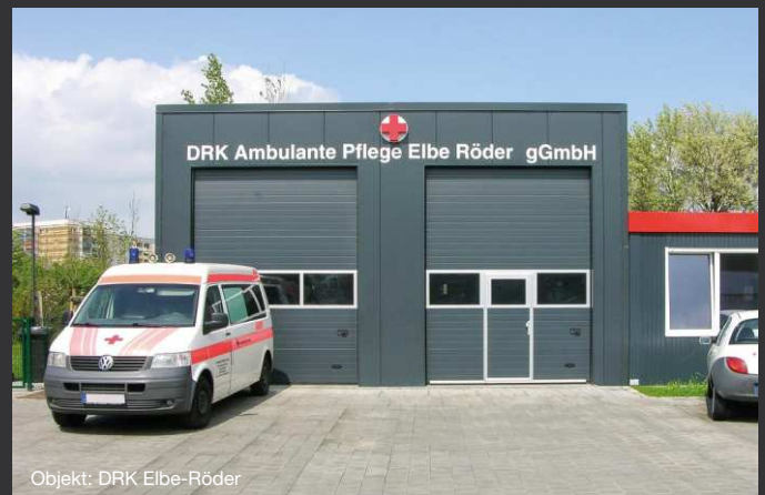
Objekt: DRK Elbe-Röder