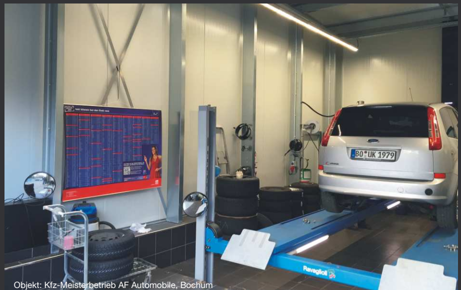
Objekt: Kfz-Meisterbetrieb AF Automobile, Bochum