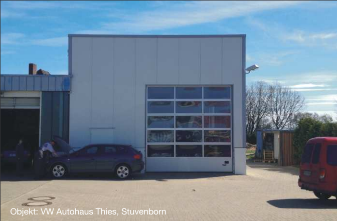
Objekt: VW Autohaus Thies, Stukenborn