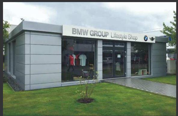
Showrooms / Raummodul-Anlagen