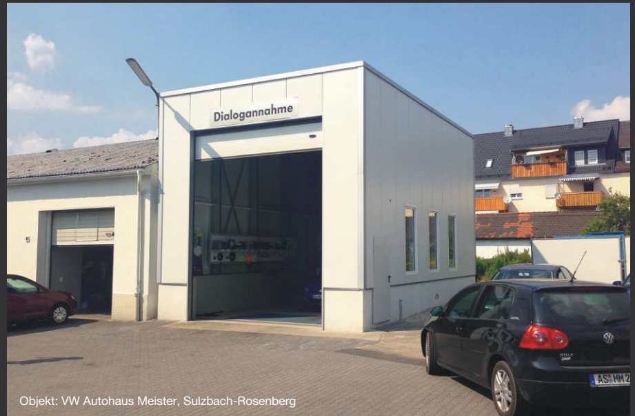
Objekt: VW Autohaus Meister, Sulzbach-Rosenberg

Die Aluminium-Zink-veredelte Stahlkonstruktion bietet größtmöglichen Korrosionsschutz und sorgt so dafür, dass die Systemleichtbauhalle eine lange Lebensdauer aufweist. Die Standard-Dachbelastung beträgt 125kg/m 2 . Mithilfe der Neigung des Pultdachs erfolgt die Dachentwässerung über ein hinten liegendes Fallrohr zentral.