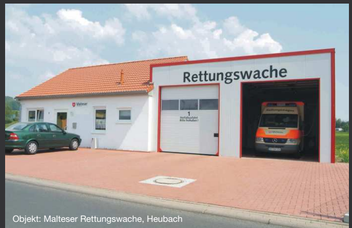
Objekt: Malteser Rettungswache, Heubach