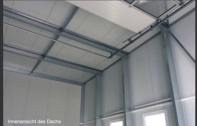
Innenansicht des Dachs