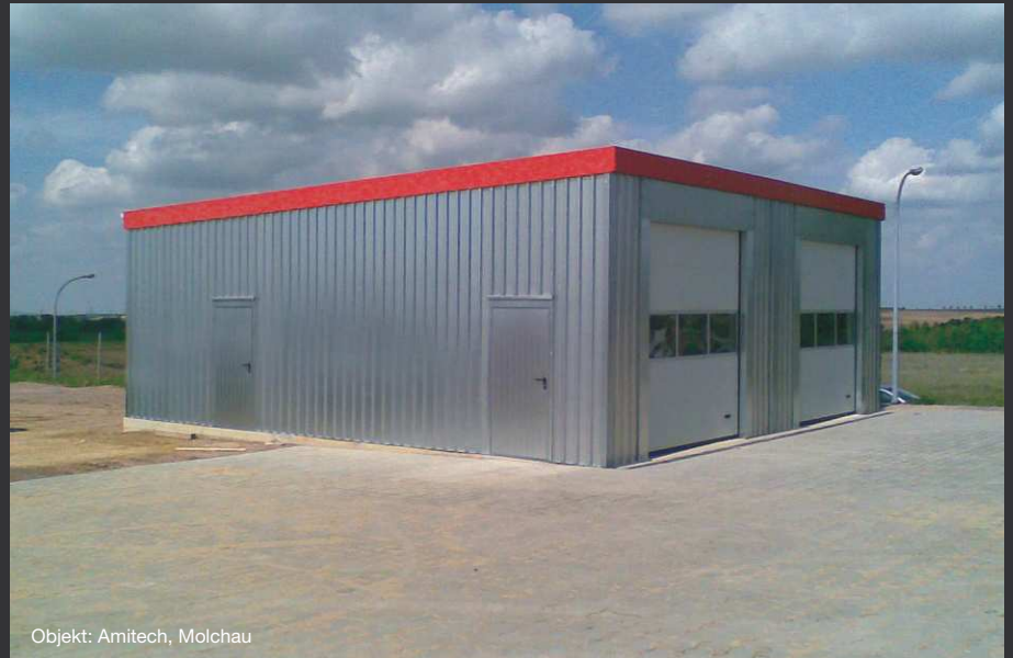
Objekt: Amitech, Molchau

Die nicht-isolierten Hallen erhalten Sie in 24 Grundgrößen mit ca. 3.500 mm oder ca. 4.500 mm Innenhöhe. Tiefe und Breite des Hallensystems lassen sich variabel zusammenstellen und im Bedarfsfall auch in Form des Sickenrasters einkürzen.