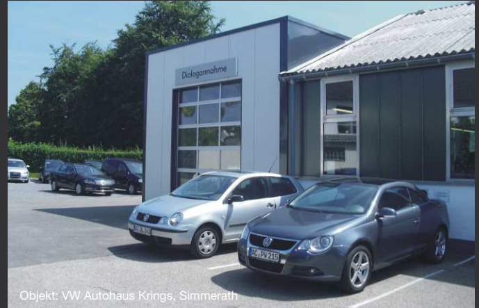
Objekt: VW Autohaus Krings, Simmerath