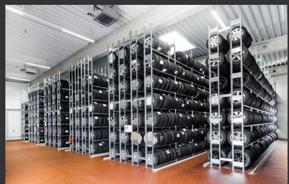
Reifenregale - preiswert ab Lager