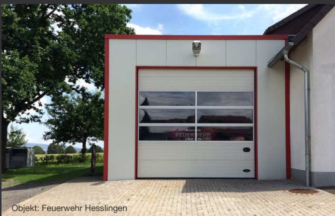
Objekt: Feuerwehr Hesslingen