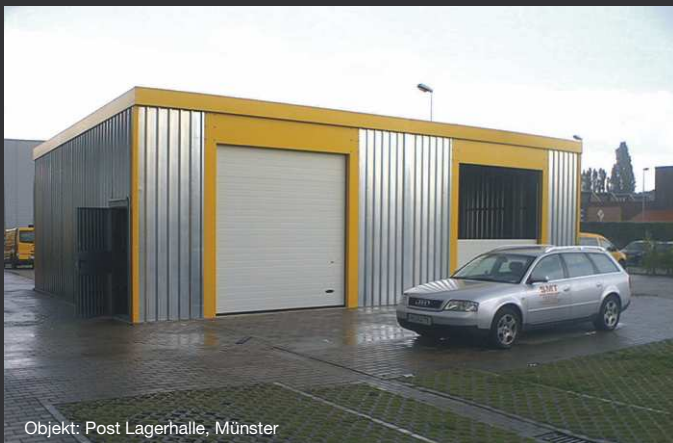
Objekt: Post Lagerhalle, Münster