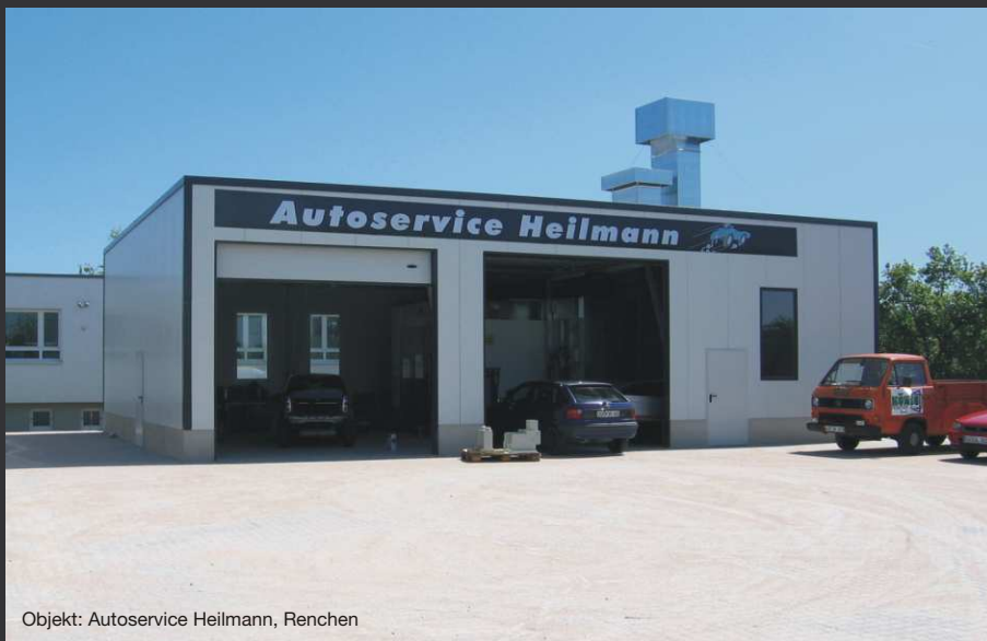
Objekt: Autoservice Heilmann, Renchen

Ein bebildertes Prospekt mit zahlreichen Referenzen ist ein guter Anfang um sich einen grundsätzlichen Eindruck zu verschaffen. Dennoch hat jedes Bauvorhaben seine eigenen Feinheiten, auf die zu achten ist. Jeder Kunde hat seine Ansprüche auf die einzugehen ist. Profitieren Sie von unserer jahrelangen Erfahrung im Hallenbau und lassen Sie sich persönlich bei Ihnen vor Ort beraten. Wir freuen auf Sie und die gemeinsame Zusammenarbeit. Hallenbau ist Vertrauenssache.