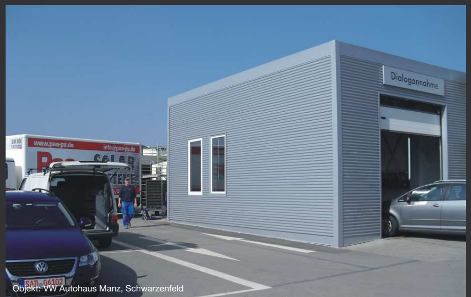
Objekt: VW Autohaus Manz, Schwarzenfeld