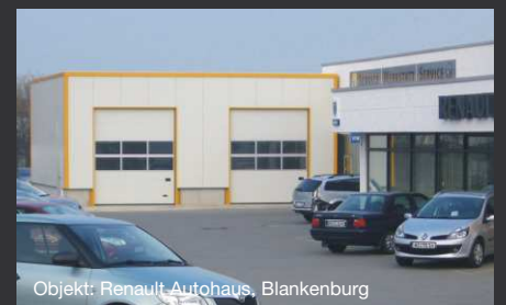
Objekt: Renault Autohaus, Blankenburg